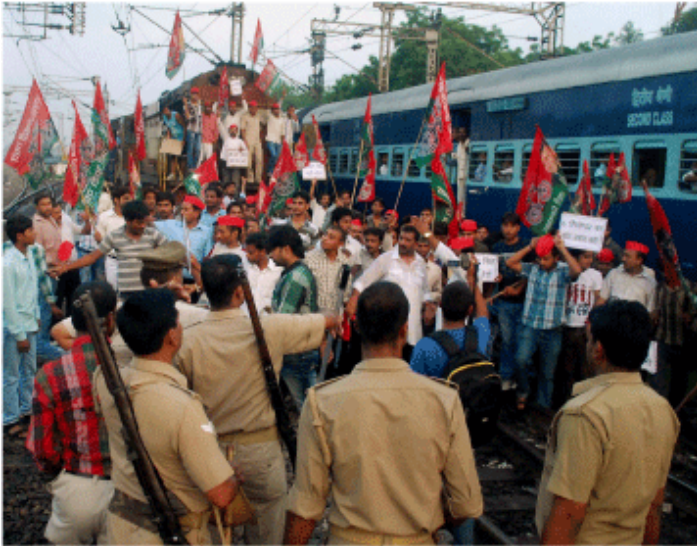
SP活動家が列車を強行停止=20日、アラハバード

外資系小売業に対する規制緩和や軽油値上げなどのシン政権の新政策に反発し、最大野党・インド人民党(BJP)が率いる国民民主連合(NDA)は20日、全土でデモを展開した。巨大外資の参入で壊滅的な打撃を受けかねない零細商店主らが加わっており、一部の州では鉄道を止めるなどの事態に発展した。日常生活への影響は地域によってばらつきが出ている。