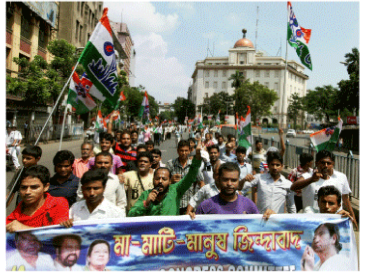
T M C 活動家が街頭をデモ行進=20日、コルカタ

しかし S P は 20 日、「U P A を現時点で支持しているが、いつまで続けるかは分からない」(ヤダブ書記長)と P T I 通信に語っており、政局が見えにくくなっている。